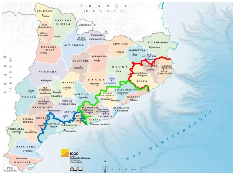
Figura 1. Entorns de Girona (línia vermella), Barcelona (línia verda) i Tarragona (línia blava)